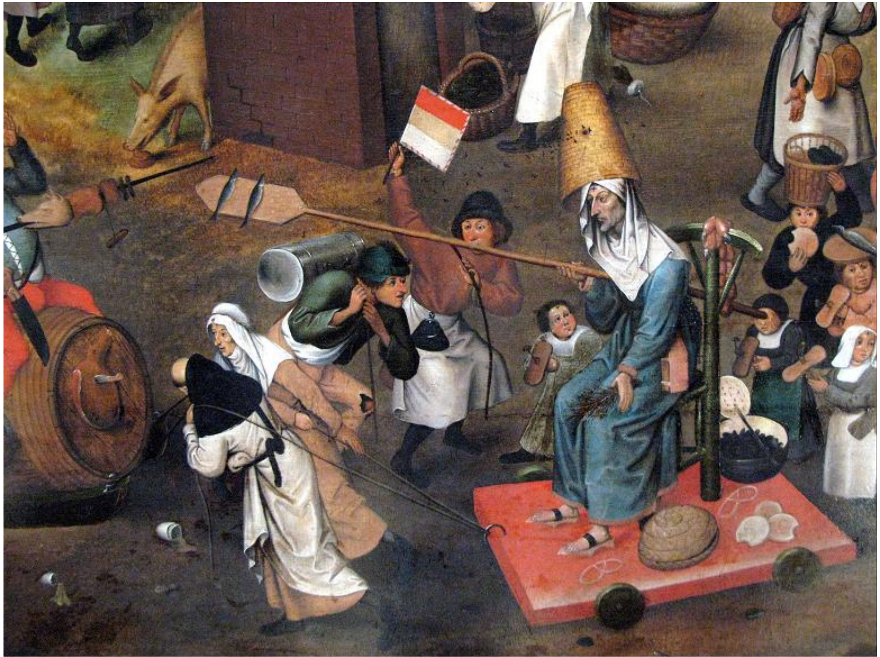
Mise en place des Chaires d'Excellence