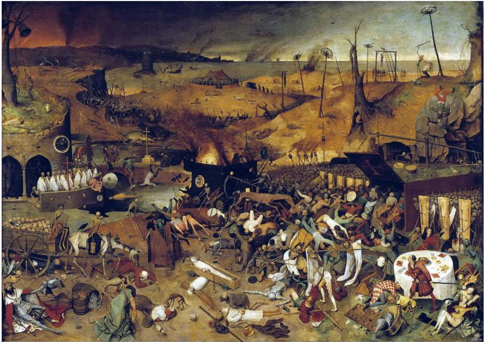
Le nouveau paysage de la recherche